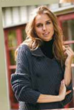
Stilfull minimalism Elegant kappa med struktur

Mjukt skönt & vackra mönster och pasteller