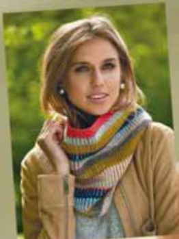
Färgrik halstus Kroka i patent

35 I detta nr nya modeller – du själv kan sticka och virka